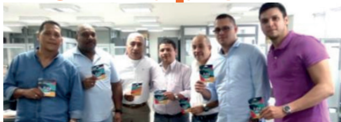
Trabajadores de la Sucursal Cali

Celebrar con todos sus afiliados el amor a los padres una vez al año, se ha convertido en algo habitual para SINTRAPREVI. A pesar de que en la actualidad se celebra el día del Padre con un regalo (la organización sindical entrega un bono como símbolo de esta celebración), esta festividad no tiene un origen comercial para aumentar las ventas en estas fechas como muchos piensan.