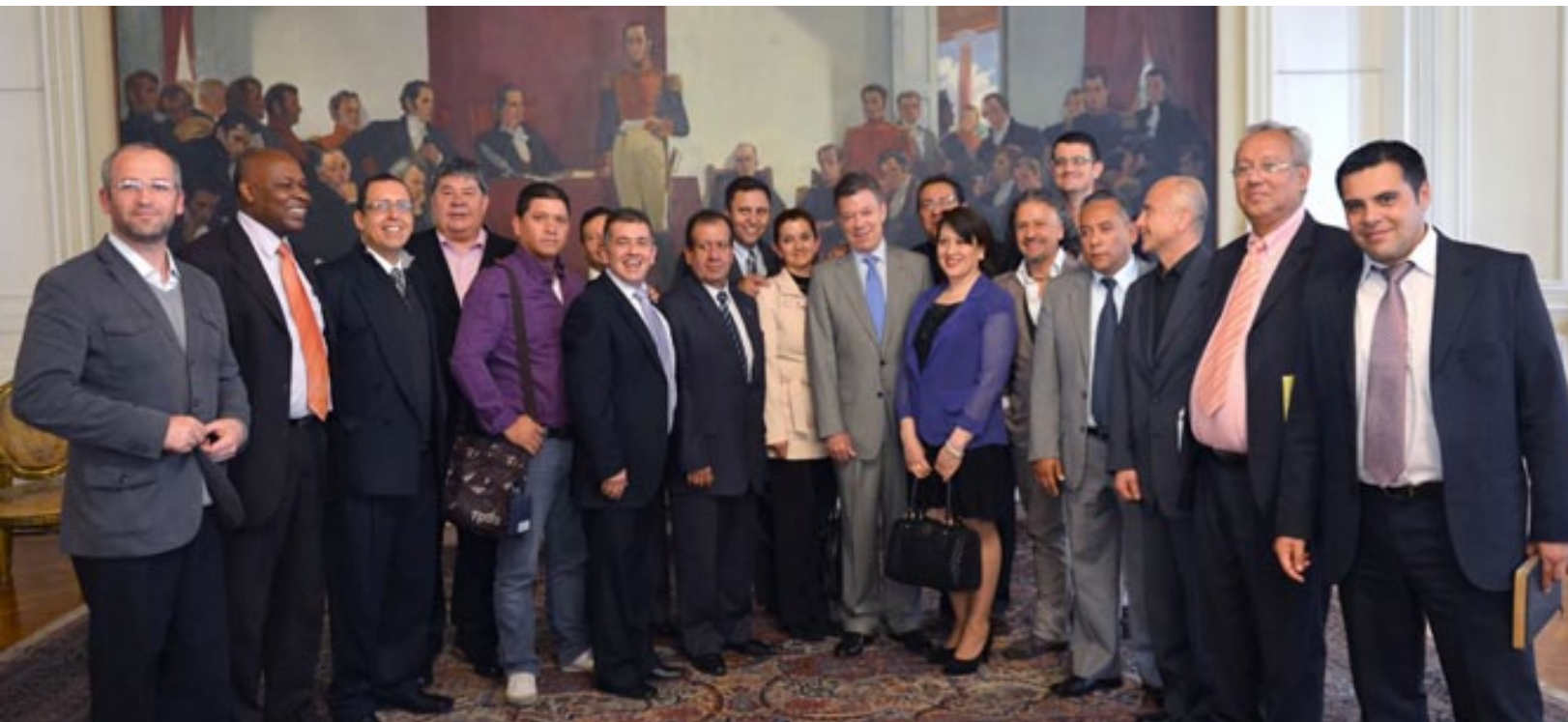
Negociadores sindicales del sector estatal y el Presidente Santos en la presentación del acuerdo.

E l jueves 14 de mayo se dio a conocer un hecho sin precedentes para el movimiento sindical: El presidente Juan Manuel Santos presentó personalmente el acuerdo laboral al que, luego de un mes de negociaciones, llegaron el Gobierno Nacional y las federaciones sindicales del sector estatal.